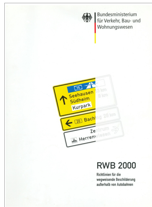
Abb. 1-1: Merkblatt zur wegweisenden Beschilderung für den Radverkehr der FGSV und RWB des BMVBS (ehem. BMVBW)